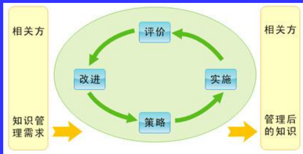
知识管理过程模型